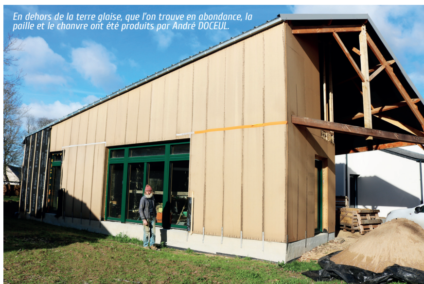
En dehors de la terre glaise, que l'on trouve en abondance, la paille et le chanvre ont été produits par André DOCEUL.

La maison est bien sûr orientée sud, avec des ouvertures conséquentes en bois alu et triple vitrage. Le garage qui se situe côté nord servira de pièce tampon, et côté sud-ouest, où est le jardin, j'installerai une serre agricole d'environ 40 m 2 qui fera aussi office d'espace tampon.