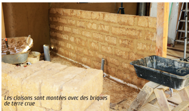
Les cloisons sont montées avec des briques de terre crue

L'aspect économique entrainé en jeu également : la construction est bien sûr plus onéreuse, avec l'étude thermique à effectuer, l'isolation renforcée, et les équipements pour capter la chaleur. Et s'agissant d'une construction neuve, on ne bénéficie pas d'avantages fiscaux ou d'aides de l'Etat. Mais avec moins de 15 kWh/m 2 /an en chauffage, et pour un confort nettement meilleur, elle est beaucoup plus économe qu'une maison basse énergie (entre 40 à 65 kWh/m 2 /an), avec un faible coût de 10 à 25 € mensuel. Ainsi on y gagne financièrement à long terme.