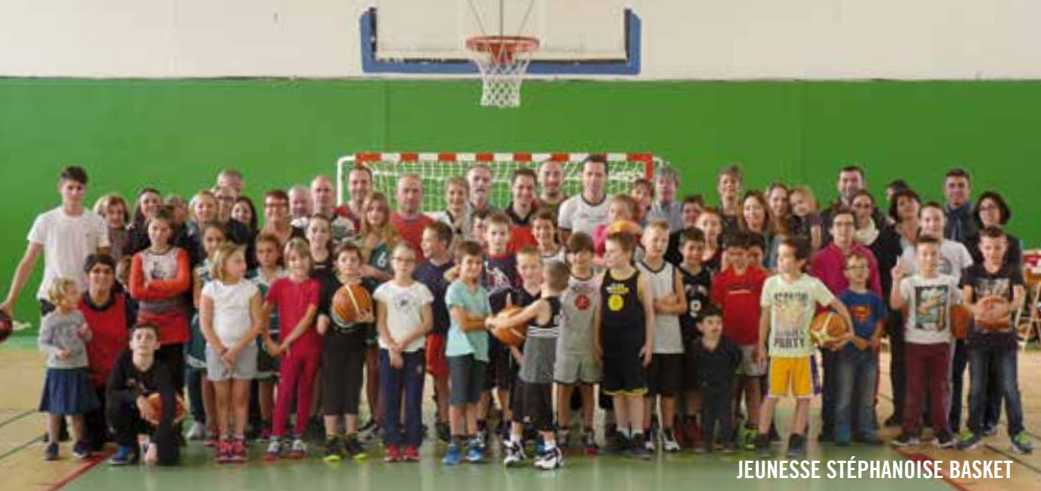
JEUNESSE STÉPHANOISE BASKET