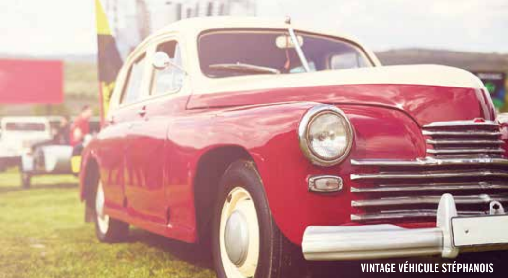
VINTAGE VÉHICULE STÉPHANOIS