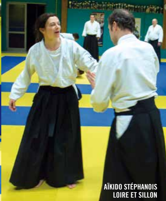
AÏKIDO STÉPHANOIS LOIRE ET SILLON