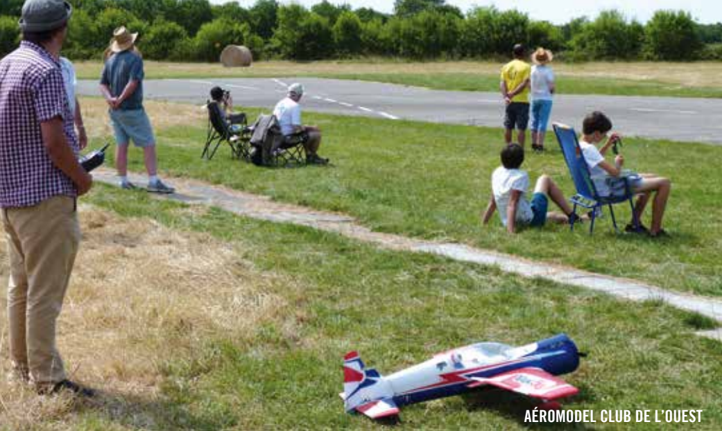
AÉROMODEL CLUB DE L'OUEST