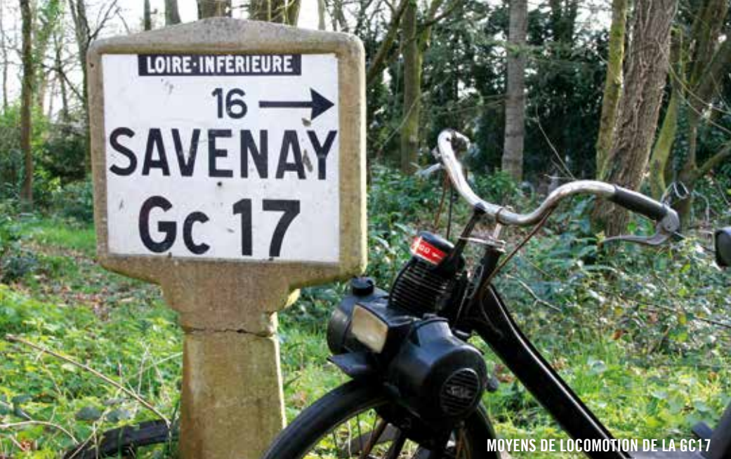
MOYENS DE LOCOMOTION DE LA GC17