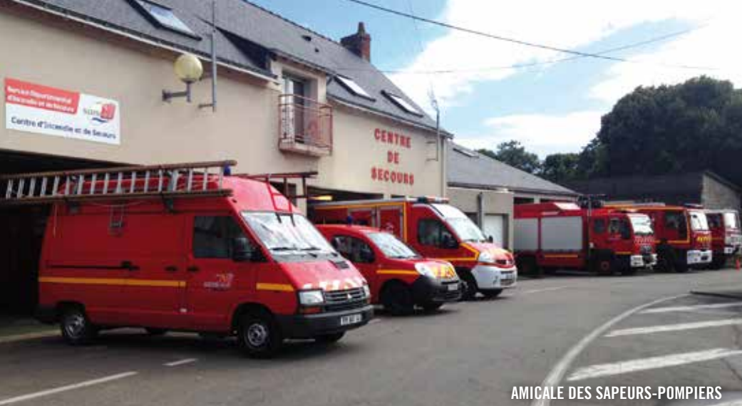
AMICALE DES SAPEURS-POMPIERS