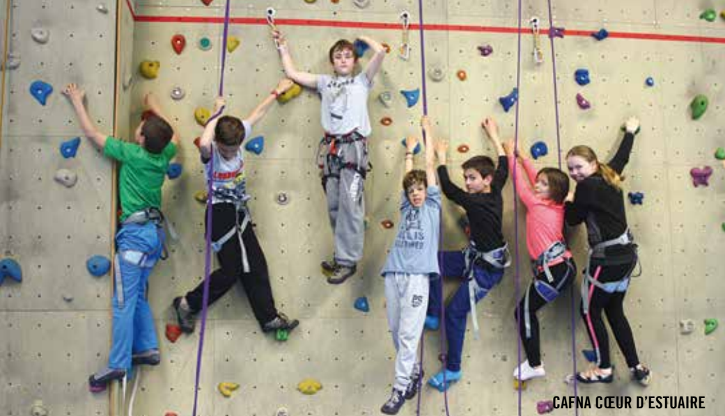
CAFNA CŒUR D'ESTUAIRE