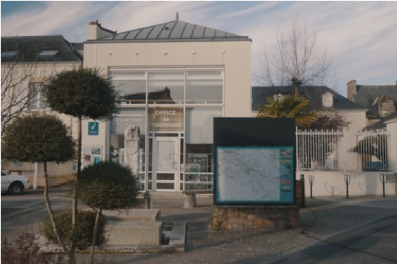
Bureau d'accueil d'Estuaire et Sillon Tourisme