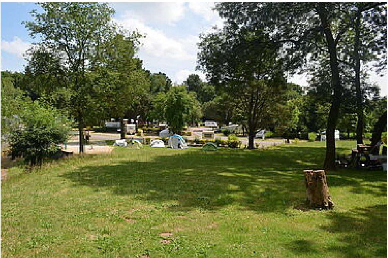
Camping municipal ***

https://www.st-etienne-montluc.net/mes-loisirs/tourisme/hebergement-2934.html