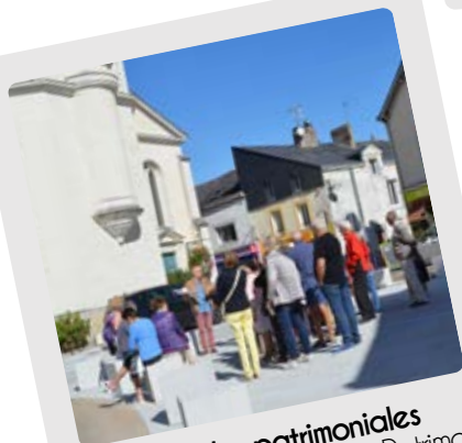
Balades patrimoniales Journées Européennes du Patrimoine 15 et 16 septembre 2018