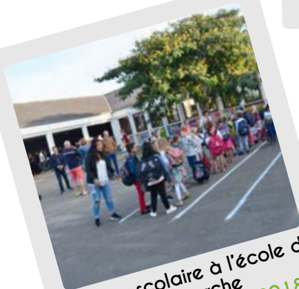
Rentrée scolaire à l'école de la Guerche Lundi 3 septembre 2018