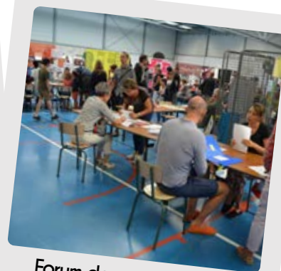
Forum des associations Samedi 8 septembre 2018