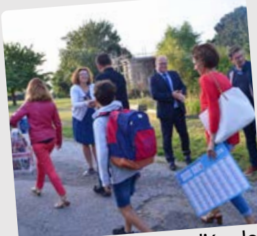
Rentrée scolaire à l'école Saint Marie Lundi 3 septembre 2018