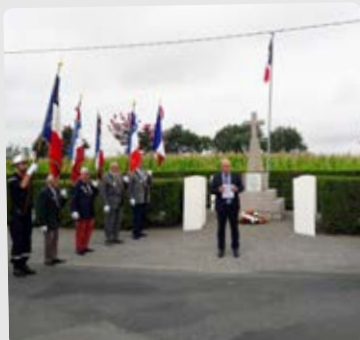
Cérémonie du Moulin Neuf Mercredi 15 août 2018