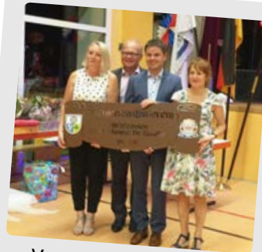
Voyage à Mulhausen Du 22 au 27 août 2018